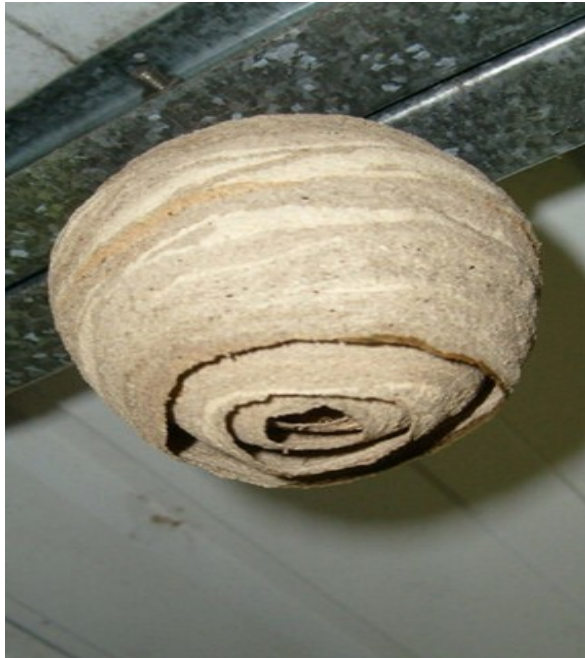
Nid Primaire (20 à 30 insectes)