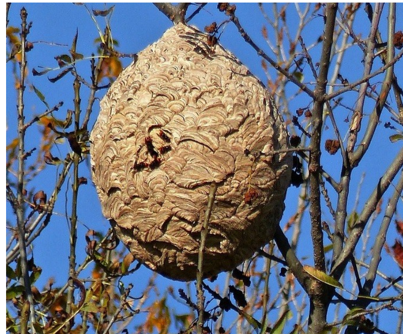
Nid secondaire (2000 à 3000 insectes)

Comme vous avez pu le constater, notre département et plus particulièrement notre commune ont vu l'apparition de cet insecte. Il va falloir nous habituer à vivre avec et il serait illusoire de croire que nous pourrions nous en débarrasser.