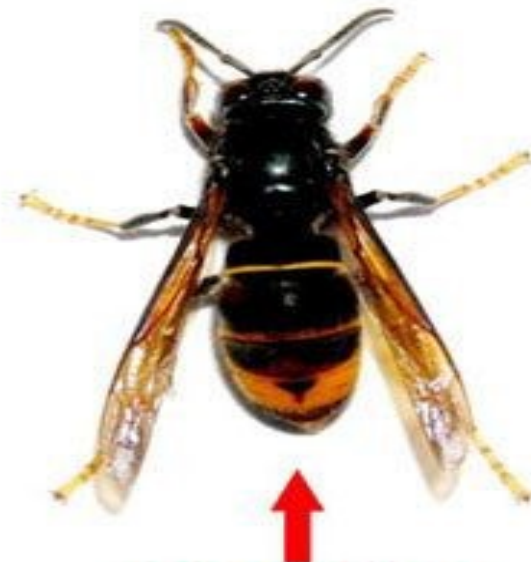
Frelon asiatique (taille réelle 3 cm)