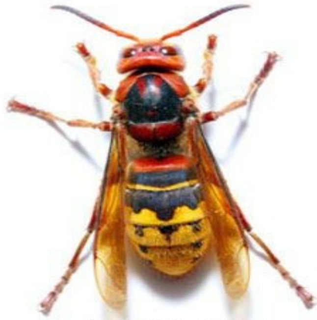
Frelon commun (jusqu'à 4 cm)