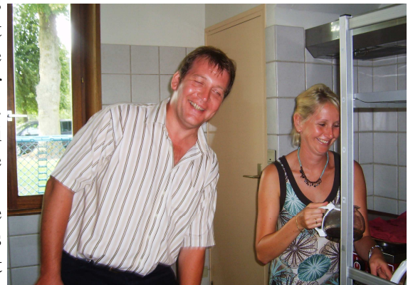
Ca bosse dur en cuisine

A ce propos, la fête de Montonvillers étant historiquement le premier week-end de septembre, nous retiendrons désormais cette date pour le repas (nous avons choisi le 31 août notamment parce que les enfants n'étaient pas encore rentrés à l'école).