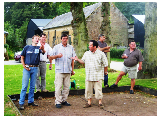
Tout point se discute !