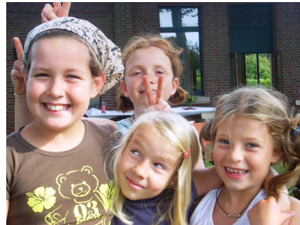
Petites bêtes à cornes