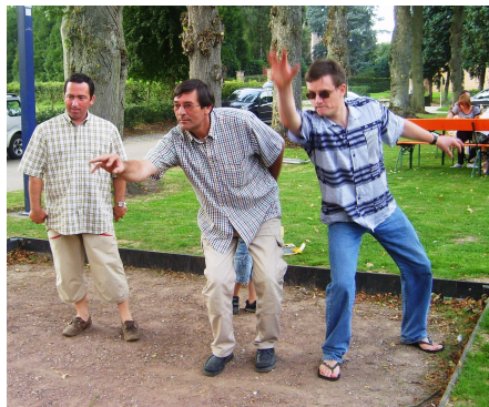
Deux styles différents